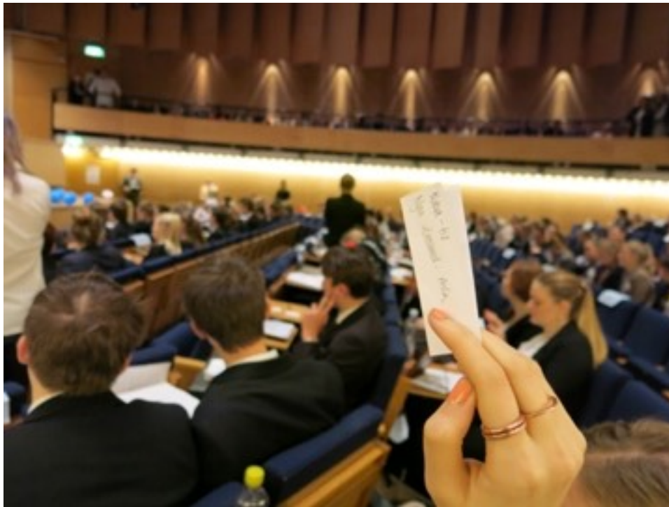
Det finns medhjälpare som kan bära lappar mellan delegationerna

Efter ett anförande i den formella debatten har presidiet möjlighet att tillfråga delegaten huruvida han är öppen för frågor. Delegaten har rätt att svara ja eller nej på presidiets fråga.